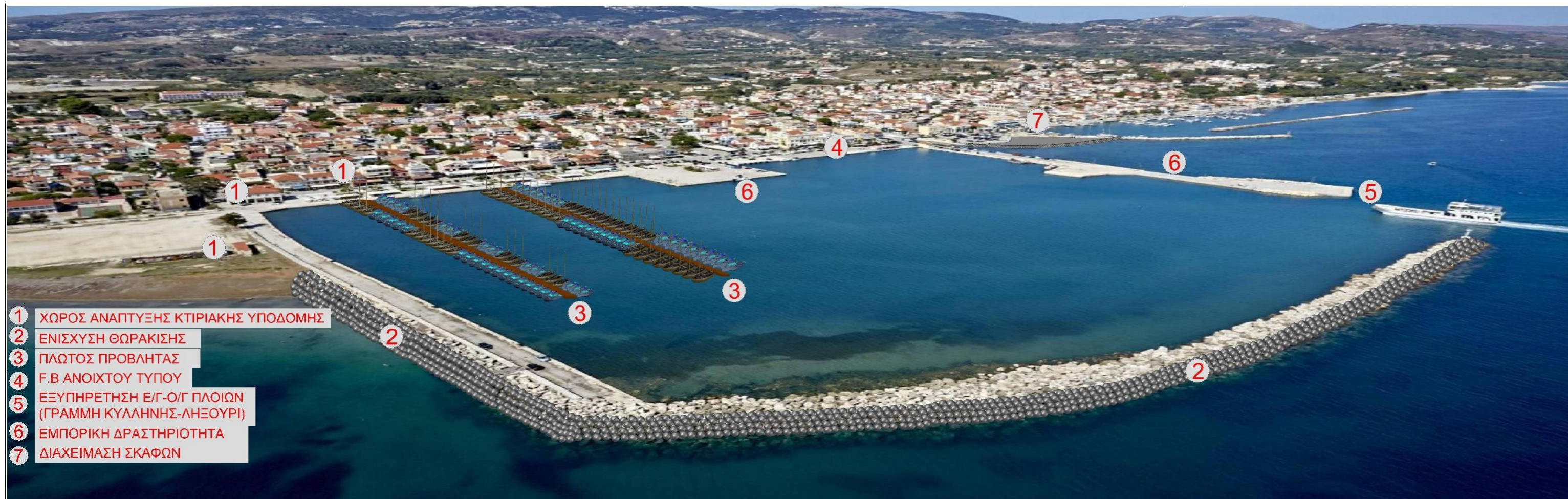
Προοπτική απεικόνιση Μαρίνας