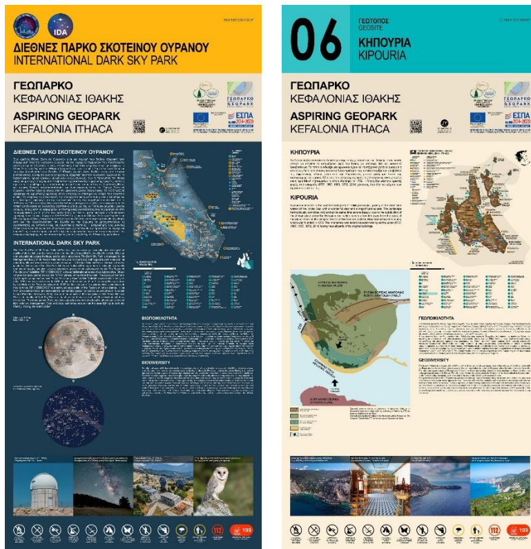
Εικόνα 2. Πινάκιδες Γεωπάρκου Κεφαλονιάς-Ιθάκης

Το γεωπάρκο στοχεύει στην προστασία και ανάδειξη του συνόλου των «μνημείων» της Γης με έμφαση στη γεωλογική κληρονομιά σε συνδυασμό με την πολιτιστική κληρονομιά και την τοπική κοινωνία ακολουθώντας μία στρατηγική βιώσιμης ανάπτυξης (όπως ο Γεωτουρισμός). Οι γεωλογικοί σχηματισμοί και οι γεωλογικές διεργασίες καθορίζουν τη φυσιογνωμία μίας περιοχής άρα και τη βιοποικιλότητά της και έχουν σημειωθεί με καλαίσθητες πινακίδες (Εικ. 3). Σε πολλές περιπτώσεις η γεωποικιλότητα θα καθορίσει και το ανθρωπογενές περιβάλλον και θα επηρεάσει σε μεγάλο βαθμό τα ήθη και τις παραδόσεις των τοπικών κοινωνιών.