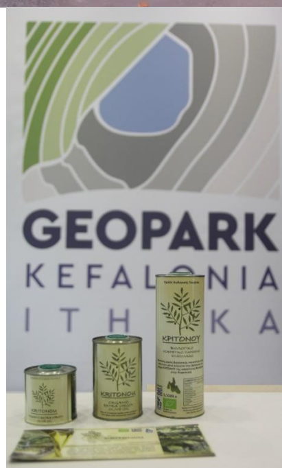
Εικόνα 4. Οι ψηφιακές εκθέσεις του Γεωπάρκου στο Κέντρο Περιβαλλοντικής Ενημέρωσης Κουτάβου και στο Πολιτιστικό Κέντρο Ανωγής με έκθεση τοπικών προϊόντων.