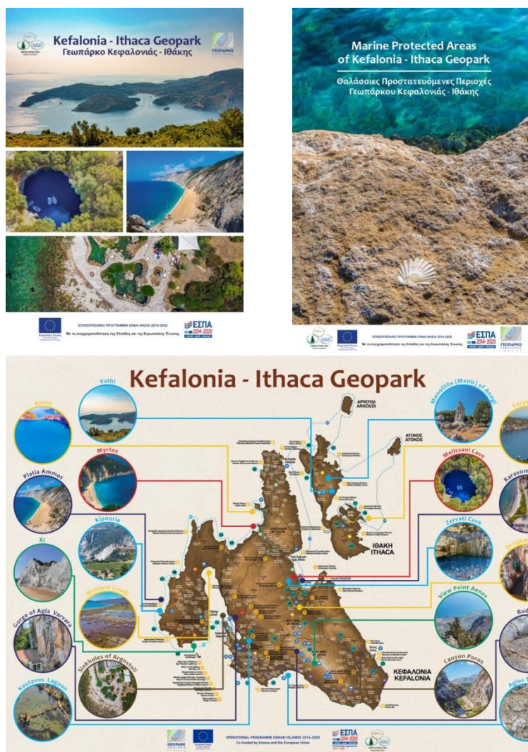
Εικόνα 3. Έντυπο υλικό Γεωπάρκου

Στο Γεωπάρκο Κεφαλονιάς και Ιθάκης έχουν καθοριστεί μέχρι τώρα 50 γεώτοποι, δηλαδή τοποθεσίες κυρίως με ιδιαίτερα γεωλογικά χαρακτηριστικά καθώς επίσης και με οικολογικά, πολιτιστικά, τουριστικά αλλά και αισθητικά. Οι περισσότεροι από τους γεώτοπους αυτούς είναι προσβάσιμοι από το υπάρχον οδικό δίκτυο και λίγοι μόνο μέσω περιπατητικών και θαλάσσιων γεωδιαδρομών. Έχει δημιουργηθεί πλούσιο έντυπο υλικό (Εικ. 4). Επίσης λειτουργούν δύο ψηφιακές εκθέσεις στο Κέντρο Περιβαλλοντικής Ενημέρωσης Κουτάβου στο Αργοστόλι και στο Πολιτιστικό Κέντρο Ανωγής στην Ιθάκη (Εικ. 5). Επίσης, υπάρχει ιστοσελίδα στην διευθυνση: www.kefaloniageopark.gr την οποία σας προσκαλούμε να την επισκεφθείτε για περισσότερες πληροφορίες σχετικά με το Γεωπάρκο, του Γεωτόπους και τις Γεωδιαδρομές του.