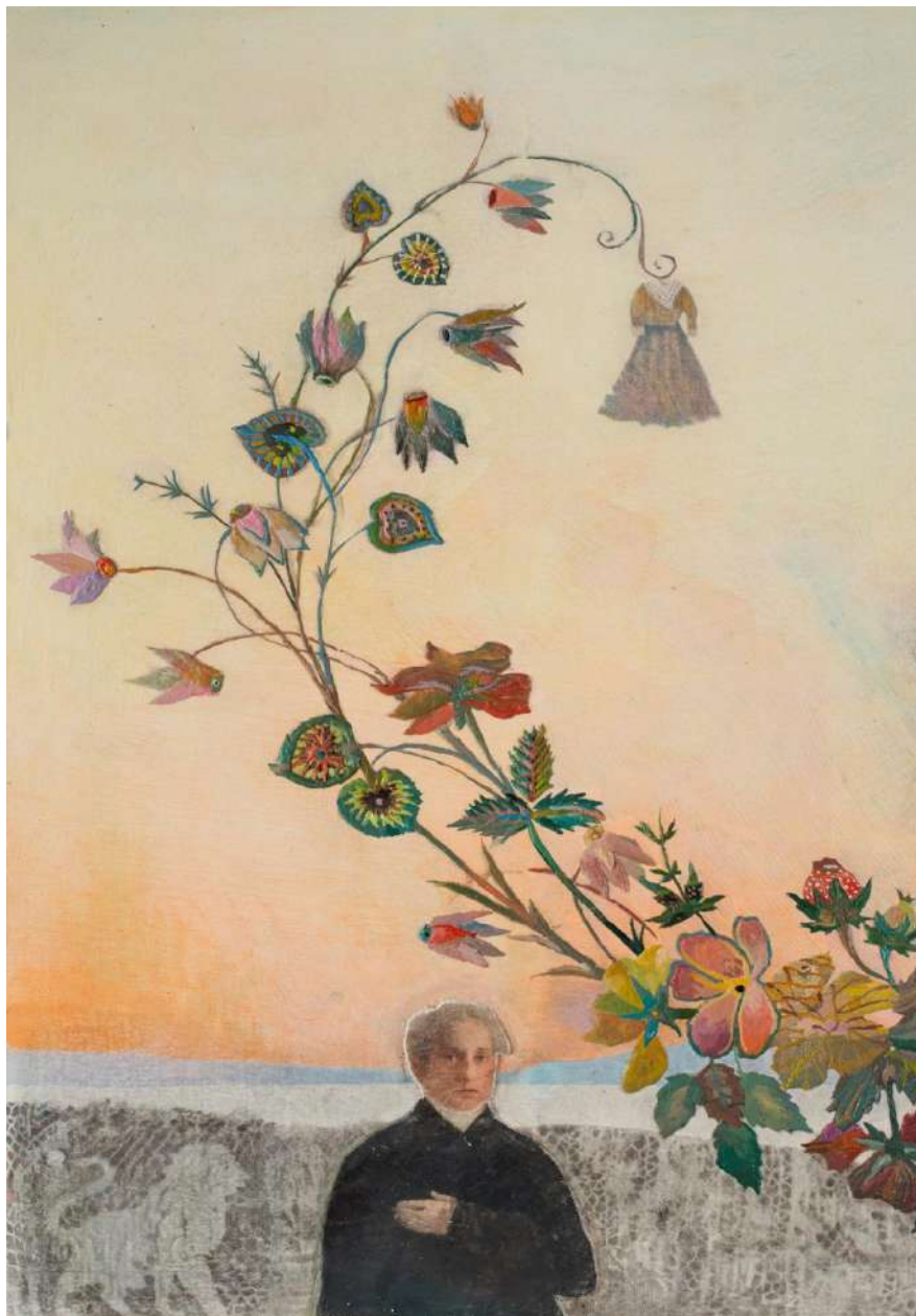
Εικ. 4. Λεπτομέρεια της εικ. 1

και ο κονδυλοφόρος του Άγγελου Σικελιανού από το ομώνυμο Μουσείο Λευκάδας (εικ. 3). Από τον βλαστό του κεντήματος, πάνω δεξιά, κρέμεται ως παλιό κουδούνι μια αστική φορεσιά του 19 ου αιώνα από το Ναυτικό και Λαογραφικό Μουσείο Ιθάκης. Κάτω αριστερά προβάλλει ημίσωμη η μορφή του Διονυσίου Σολωμού (εικ. 4) , με λάδι πάνω σε κερί, από προσωπογραφία του ποιητή στο Μουσείο Σολωμού και Επιφανών Ζακυνθίων` και λίγο αριστερότερα απεικονίζεται ο λέων της Βενετίας από βαμβακερή δαντέλλα επίσης από το Ναυτικό και Λαογραφικό Μουσείο Ιθάκης , ως υπόμνηση της Βενετοκρατίας