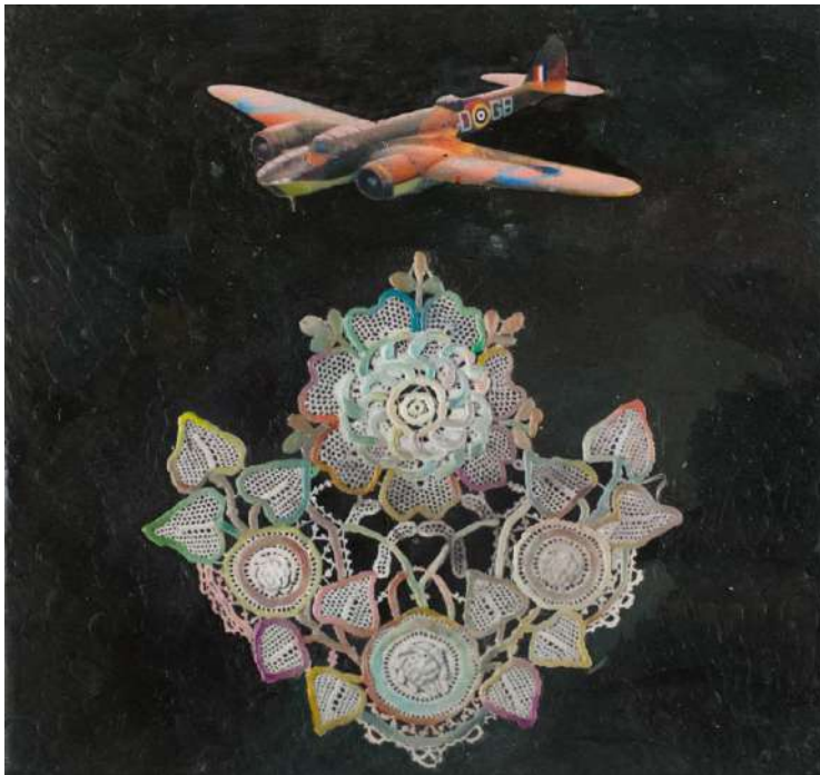
Εικ. 7. Αλέξης Αυλάμης, Πόλεμος και ειρήνη , 2022, εγκαυστική και λάδι σε ξύλο, 30x30 εκ.

Εκείνο που αποκομίζει κανείς παρατηρώντας τα έργα του Αλέξη Αυλάμη είναι η διαπίστωση, ότι πίσω από τη φαινομενική απλότητα κρύβεται πολλή σκέψη, έρευνα και πειραματισμός. Οι ευδόκιμες σπουδές του στην Ανωτάτη Σχολή Καλών Τεχνών Αθηνών, από την οποία αποφοίτησε με «Άριστα», και οι σπουδές του στην Αμερική αλλά και οι οικογενειακές καταβολές, με τη μακρά επιστημονική παράδοση και το κλίμα του επτανησιακού πολιτισμού στο σπίτι, του παρέχουν ένα γερό θεωρητικό και τεχνικό οπλισμό, ώστε να λειτουργεί ως επιστήμονας-καλλιτέχνης, ιδιότητα που λίγους σύγχρονους ομοτέχνους του χαρακτηρίζει. Η κληρονομιά που άφησε ο Λεονάρντο ντα Βίντσι και άλλοι αναγεννησιακοί καλλιτέχνες αντανακλάται ως τον Αλέξη Αυλάμη, ώστε δεν είναι τυχαία η διεθνής, ευρεία απήχηση του έργου του. Ειδικά στην παρούσα έκθεση, την οποία ο ίδιος θεωρεί σταθμό στην καλλιτεχνική του πορεία – και είναι πράγματι- η αφαίρεση από τη σύνθεση κάθε περιττού παραπληρωματικού στοιχείου και ο περιορισμός στο ουσιώδες είναι τεκμήρια της εικαστικής του ωρίμανσης. Ο ίδιος θεωρεί ότι το λιτό, υπαίθριο εργαστήριό του στην Κεφαλονιά και το αδρό φυσικό περιβάλλον τον βοήθησαν να εκφραστεί λακωνικά.