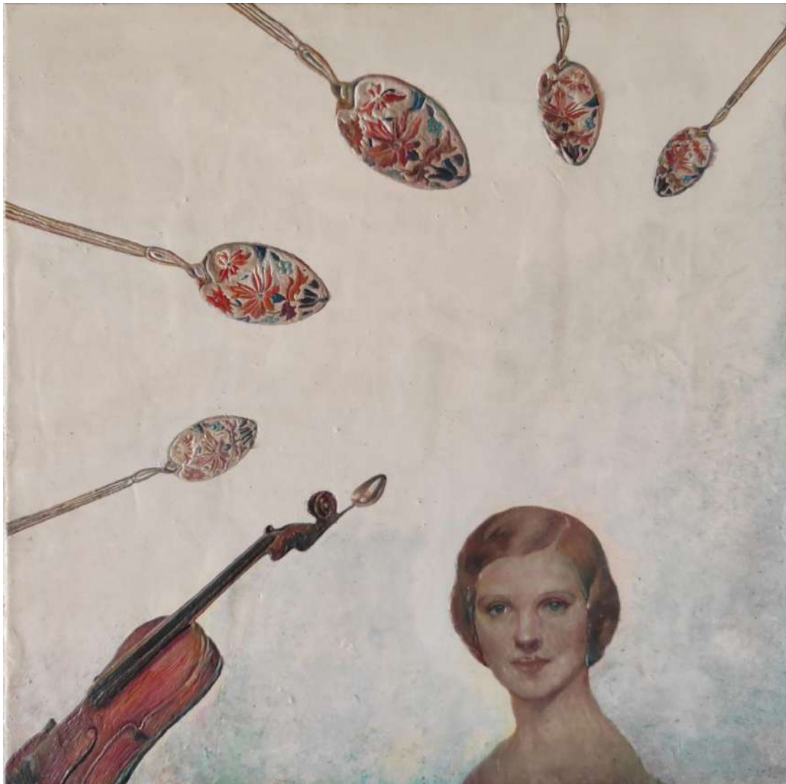
Εικ. 1 Αλέξης Αυλάμης, Ενορχηστρώνοντας την Αριστοκρατία , 2022, κηρόχρωμα με λάδι πάνω σε σανίδα, 60x60 εκ.

Κοργιαλέναιο Ιστορικό & Λαογραφικό Μουσείο Αργοστολίου