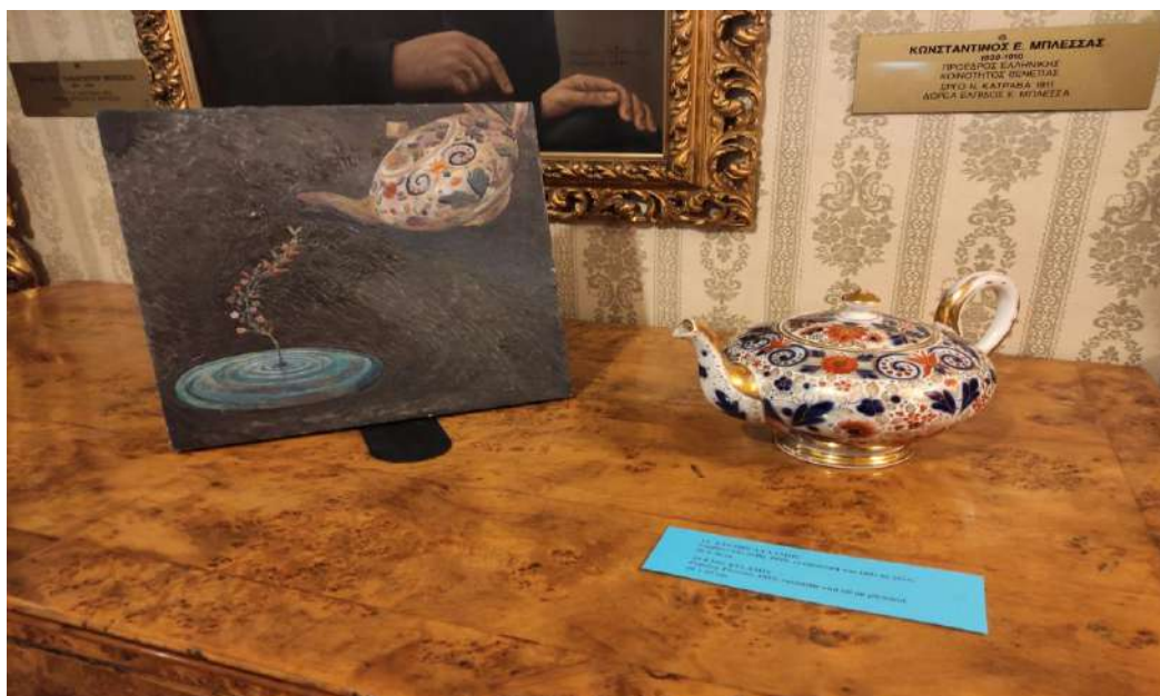
Εικ. 6. Το πραγματικό αντικείμενο δεξιά (αγγλική τσαγιέρα από πορσελάνη) και το «είδωλό» του αριστερά (στον πίνακα).

Έχει ενδιαφέρον ο τρόπος που εργάστηκε, για να μπορέσει να ανταποκριθεί σε ελάχιστο χρόνο στις ανάγκες μιας απαιτητικής έκθεσης, ώστε τα νέα έργα, εκτεθειμένα δίπλα στα μουσειακά αντικείμενα, να στέκονται ισότιμα με αυτά και να εκπέμπουν τη δική τους αύρα. Αφού περιηγήθηκε όλους τους χώρους του μουσείου, διάλεξε τα αντικείμενα, τα οποία με την πρώτη ματιά και για ανεξήγητο λόγο τού τράβηξαν την προσοχή. Στη συνέχεια τα απομόνωσε από το εκθεσιακό τους περιβάλλον, τα ζωγράφησε παραστατικά και τα ενέταξε σε μια δικής του επινόησης υπερρεαλιστική σύνθεση (εικ. 5). Στην πραγματικότητα είναι και αυτά ονειρικά τοπία, όπως ήταν η μέχρι τώρα δουλειά του, με τη διαφορά ότι πρόκειται για πολύ λιτές συνθέσεις χωρίς την πυκνότητα και τον «φόβο του κενού» των προηγούμενων έργων. Όπως ο ίδιος εξηγεί, η πίεση του χρόνου τον ανάγκασε να βρίσκεται σε διαρκή εγρήγορση, μέσα από την οποία εξελίχθηκε τεχνικά και προσανατολίστηκε «προς μια οικονομία του εικονικού λόγου». Εκτός αυτού, ζωγραφίζοντας πιστά το μουσειακό αντικείμενο και εκθέτοντάς το δίπλα στο πρωτότυπο, κατορθώνει να βοηθήσει τον θεατή να αντιληφθεί ευκολότερα την αντιπαραβολή ειδώλου (του ζωγραφικού έργου) και πραγματικού αντικειμένου (εικ.6).