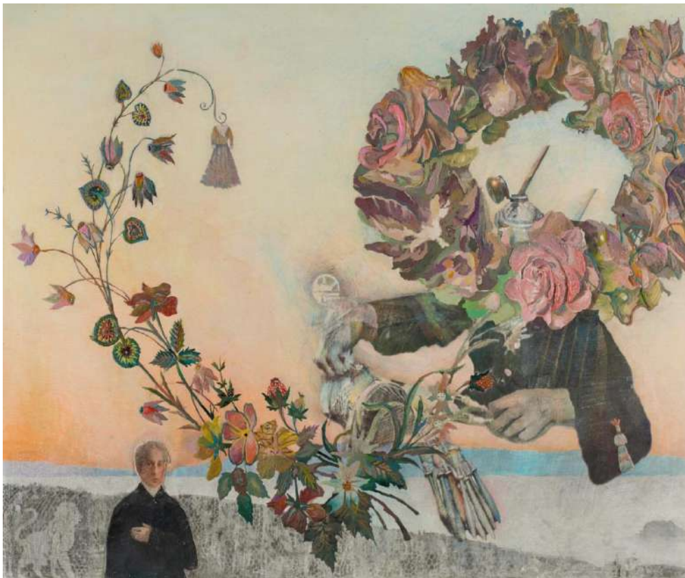
Εικ. 2. Αλέξης Αυλάμης, Σε κοινό τόπο βαδίζουμε , 2022, εγκαυστική με λάδι και ξυλοχρώματα σε ξύλο, 55x75 εκ., ιδιωτική συλλογή.

Το 2021 ο Αλέξης Αυλάμης συμμετέσχε, ως εκπρόσωπος του Κοργιαλενείου Ιστορικού και Λαογραφικού Μουσείου Αργοστολίου, στην ψηφιακή έκθεση που οργάνωσε το Μουσείο Σολωμού και Επιφανών Ζακυνθίων με τίτλο Επτανησιακός Πολιτισμός: Από το χθες στο σήμερα . Στο πλαίσιο της, έξι σύγχρονοι Επτανήσιοι καλλιτέχνες, τρεις μουσικοί και τρεις ζωγράφοι, ανέλαβαν να συνθέσουν έργα εμπνευσμένα από τα εκθέματα των δεκατριών τότε μουσείων του Δικτύου Μουσείων Ιονίων Νήσων, με απώτερο στόχο να ανιχνευτούν τα κοινά πολιτιστικά στοιχεία αλλά και οι ιδιαιτερότητες του κάθε νησιού. Ο Αλέξης Αυλάμης, ως «έτοιμος από καιρό», φιλοτέχνησε μια πολύ ενδιαφέρουσα σύνθεση (εικ. 2).