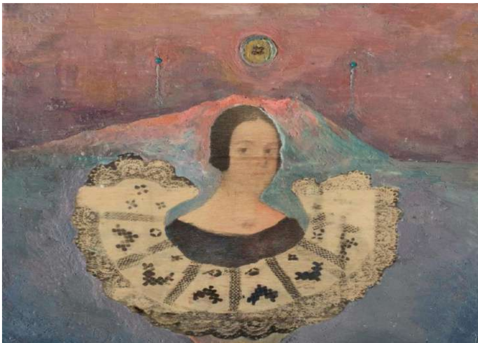
Εικ. 8. Αλέξης Αυλάμης, Η Ηχώ του παρελθόντος , 2022, εγκαυστική με λάδι πάνω σε ξύλο, 24x30 εκ.

Ο συσχετισμός ετερόκλητων αντικειμένων , όπως για παράδειγμα στον πίνακα με τον τίτλο Πόλεμος και Ειρήνη (εικ. 7), στον οποίο συνυπάρχουν μια εκλεπτυσμένη δαντέλλα-δείγμα πολιτισμού και ένα πολεμικό αεροπλάνο - εκείνο που βομβάρδισε το Αργοστόλι- συνθέτουν μια αινιγματική εικόνα, την οποία μπορεί κανείς να την αποκρυπτογραφήσει εύκολα και να εισπράξει το μήνυμα, ότι δηλαδή ο πόλεμος απειλεί τον πολιτισμό. Η μνημειακή απόδοση της δαντέλλας ωστόσο, γεννά άλλους, θετικούς συνειρμούς... Η αποκρυπτογράφιση του νοήματος , βέβαια, δεν είναι πάντοτε εύκολη. Ο Υπερρεαλισμός (Surrealismus) ως τεχνοτροπία διαμαρτύρεται ενάντια σε κάθε ορθολογισμό και φέρνει στο φως εικη και ως έτυχε εικόνες απωθημένες στο υποσυνείδητο, χωρίς κανένα λογικό συσχετισμό μεταξύ τους, με το ένδυμα όμως ενός συνεπούς Ρεαλισμού, που μπορεί να φθάσει ως τα όρια της παρωδίας. Ο αυτοματισμός, που χαρακτηρίζει τον ζωγράφο, ο οποίος ακολουθεί τον Υπερρεαλισμό, οδηγεί το χέρι του αυτόματα χωρίς τον έλεγχο της λογικής, χωρίς αυτολογοκρισία, χωρίς καθιερωμένες εικαστικές συμβάσεις, ώστε αυτός να διερευνά ελεύθερα το υποσυνείδητο και να φέρνει τελικά στο φως, με τη διαδικασία του παιγνιδιού, εικόνες με ιδεολογικό περιεχόμενο, το οποίο αποκαλύπτει και την πολιτική στάση του δρώντος υποκειμένου.