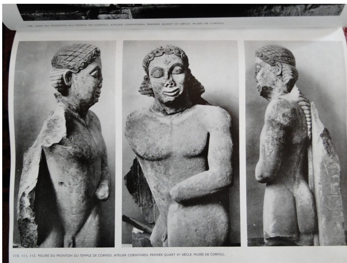
Κορινθιακό εργαστήριο, Μορφή από την πρόσοψη του αρχαϊκού ναού στην Κέρκυρα , 6 ος αι., Κέρκυρα, Αρχαιολογικό Μουσείο(από Ζερβος 1934, εικ. 11, 112, 113).

Στο βιβλίο του Ζερβού, Η τέχνη στην Ελλάδα , δημοσιεύονται 368 ασπρόμαυρες φωτογραφίες αρχαιολογικών ευρημάτων και έργων από τον Κυκλαδικό, τον Μινωικό, τον Μυκηναϊκό πολιτισμό και την αρχαϊκή