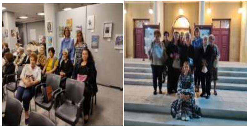
Χριστουγεννιάτικες Δράσεις μας