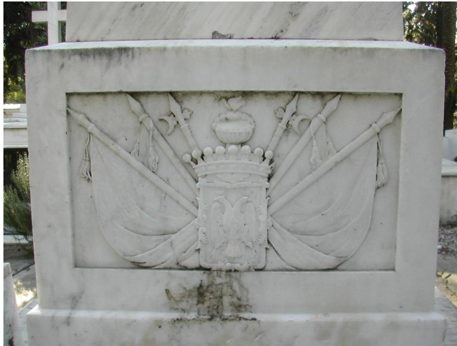
Εικ. 3. Το υπόβαθρο της στήλης με το ανάγλυφο, λεπτ. εικ. 1.

κατάλοιπο του αρχαίου ενδύματος γύρω από τον ώμο και η κλασικιστική γυμνότητα συνδέουν τον νεκρό με την αρχαιότητα και ολοκληρώνουν τον αφηρωισμό του. Η ηρωική του φυσιογνωμία δηλώνεται και με τα «τρόπαια», το σύμπλεγμα σημαιών και «σιδηροπελέκεων» κάτω από το οικόσημο της οικογένειας Μεταξά, στο υπόβαθρο της στήλης, (εικ.3).