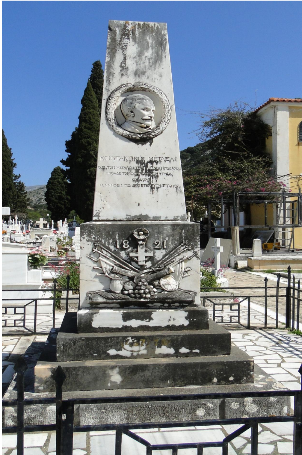
Εικ. 4. Άγνωστος, Ταφικό Μνημείο Κωνσταντίνου Μεταξά, μετά το 1873, πάνω από 4 μ., λευκό μάρμαρο, Αργοστόλι, Νεκροταφείο Δραπάνου.

Το μνημείο του Κωνσταντίνου Μεταξά (1793-1870), στο Νεκροταφείο του Δραπάνου στο Αργοστόλι, είναι έργο