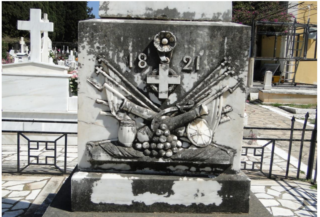
Εικ. 6. Το υπόβαθρο της Στήλης με το ανάγλυφο, λεπτ. της εικ. 4.

Στην πίσω πλευρά του υποβάθρου εικονίζεται το οικόσημο της οικογένειας Μεταξά: πάνω σε μία σφαίρα πατεί περιστέρι, το οποίο κρατεί με το ράμφος του κλαδί ελιάς και φέρει στέμμα κόμητος.