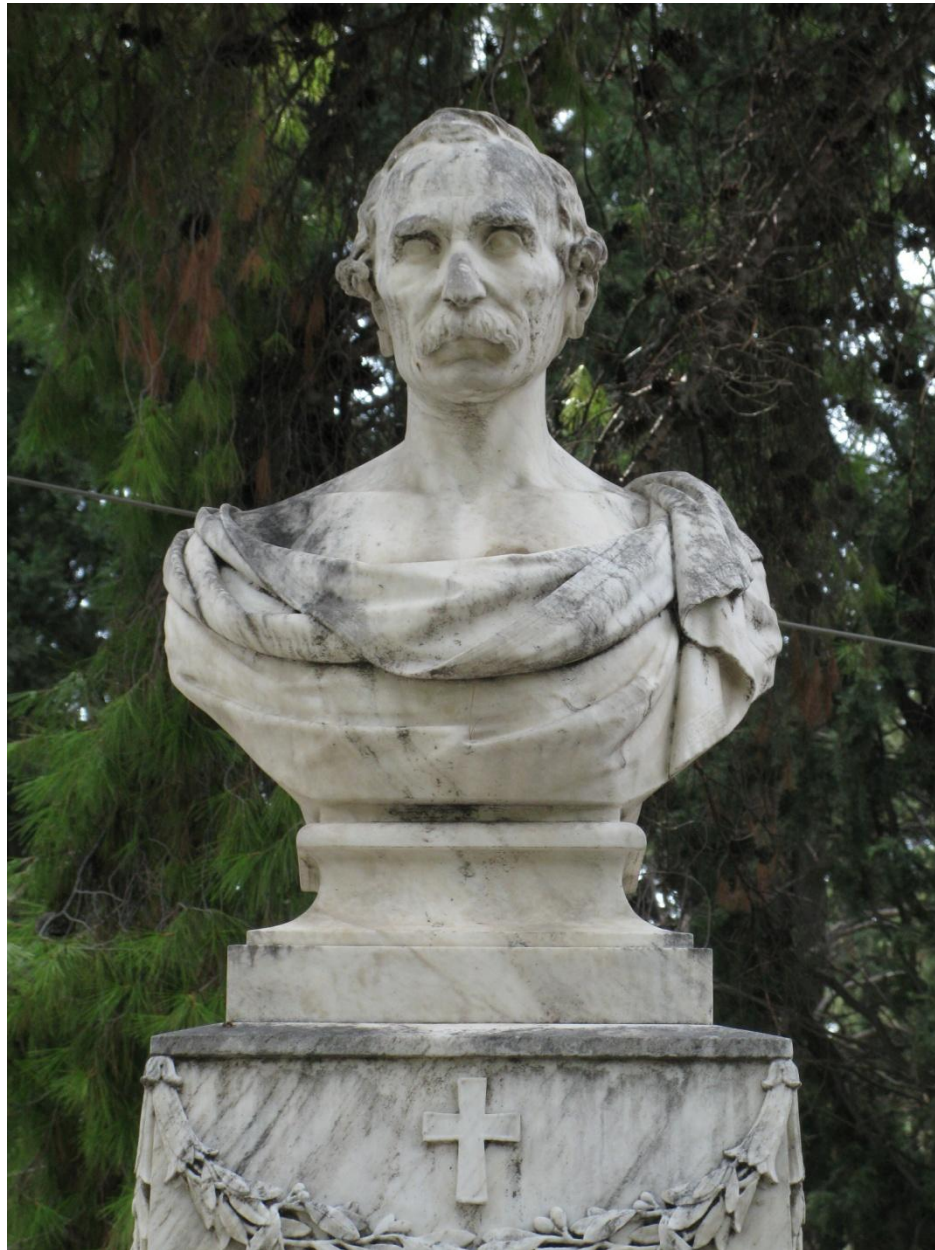
Εικ. 2. Η προτομή του Ανδρέα Μεταζά, λεπτ. της εικ. 1.

διάδρομο του Α΄ Νεκροταφείου Αθηνών. Είναι έργο των Αδελφών Γεωργίου και Λαζάρου Φυτάλη, οι οποίοι συγκαταλέγονται στους πρώτους σπουδασμένους Νεοέλληνες γλύπτες, και τα έργα τους προκαλούσαν εθνική υπερηφάνεια. (εικ. 1).