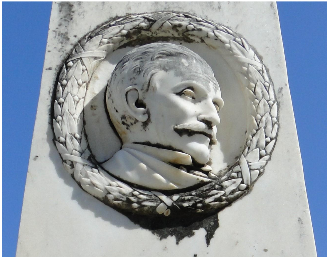
Εικ. 5. Το κεφάλι του Κωνσταντίνου Μεταξά, λεπτ. της εικ. 4

άγνωστου προς το παρόν καλλιτέχνη, φιλοτεχνηθέν μετά το 1873. Πάνω σε μια τετράγωνη βάση, δύο αναβαθμούς και ορθογώνιο υπόβαθρο, υψώνεται ένας ψηλός οβελίσκος, πανάρχαιο σύμβολο αιωνιότητας, κατάλληλος τύπος μνημείου στον τάφο ενός ήρωα (εικ. 4). Στην πρόσθια πλευρά του, μέσα σε κλειστό, σφικτοπλεγμένο, δάφνινο στεφάνι, φέρει ανάγλυφο το κεφάλι του ηρωικού νεκρού, κατά τομή προς τα δεξιά ως προς τον θεατή, με ατομικά, φυσιγνωμικά χαρακτηριστικά και θεληματική έκφραση(εικ. 5). Τόσο η απόδοση της μορφής του νεκρού όσο και το στεφάνι αποκαλύπτουν ικανό καλλιτέχνη.