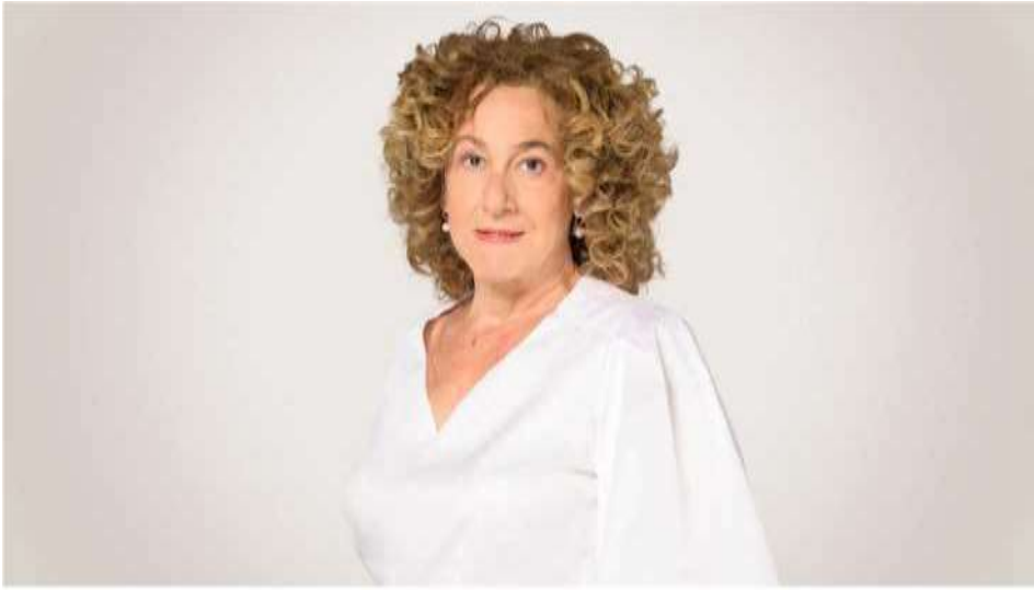
Αφροδίτη Κτενά. Ηλεκτρολόγος μηχανικός, με διδακτορικό δίπλωμα από το \Lambda\sigma\alpha\theta\alpha\theta\epsilon\text{ M}\theta\iota\iota\sigma\eta υψίνθΓΉϊγ (ΗΠΑ). Καθηγήτρια του Εθνικού Καποδιστριακού Πανεπιστημίου Αθηνών και επισκέπτρια καθηγήτρια στο Εθνικό Μετσόβιο Πολυτεχνείο. Μέλος του Τμήματος Παιδείας και Έρευνας της ΚΕ του ΚΚΕ.