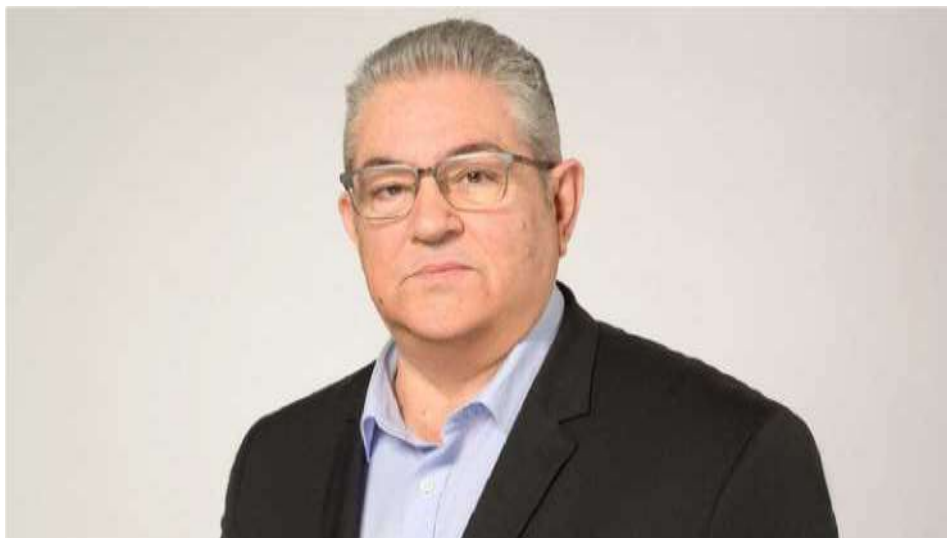
Ο ΓΓ της ΚΕ του ΚΚΕ, Δημήτρης Κουτσούμπας, κρατάει την έδρα της Φθιώτιδας.