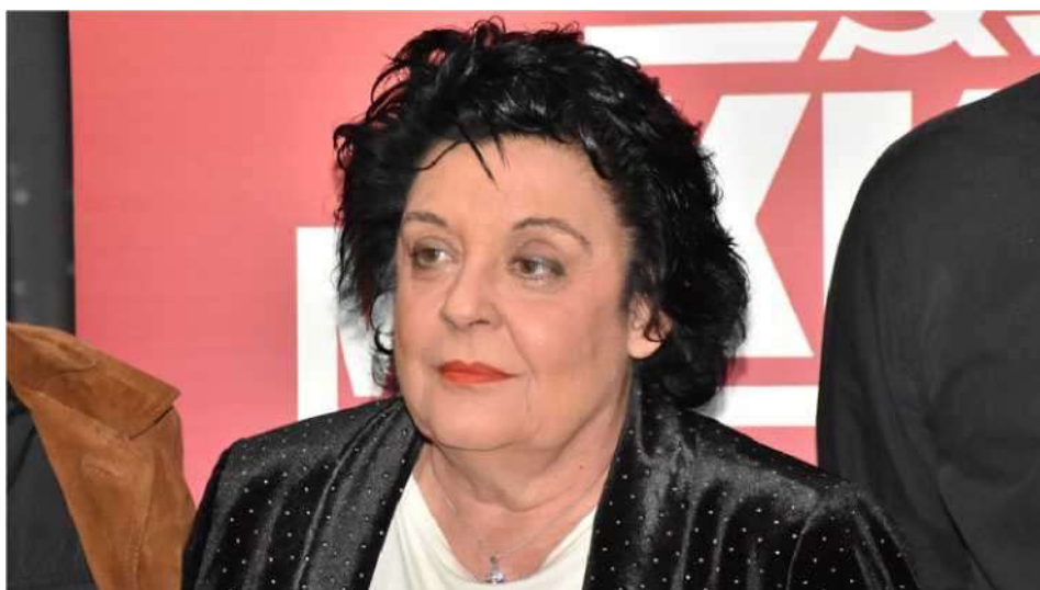
Λιάνα Κανέλλη. Βουλευτής του ΚΚΕ στην Α' Αθήνας από το 2000. Απόφοιτη της Νομικής Αθηνών, δικηγόρος και δημοσιογράφος.