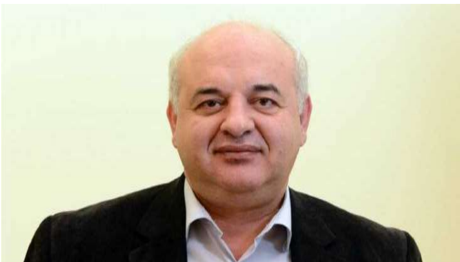
Νίκος Καραθανασόπουλος. Μέλος της ΚΕ του ΚΚΕ. Οικονομολόγος.