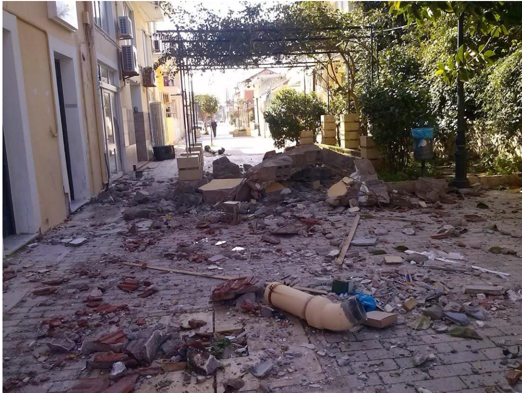
Εικόνα 3 : Ο πεζοδρόμος της Γρηγ. Λαμπράκη στο Ληξούρι λίγο μετά τους σεισμούς