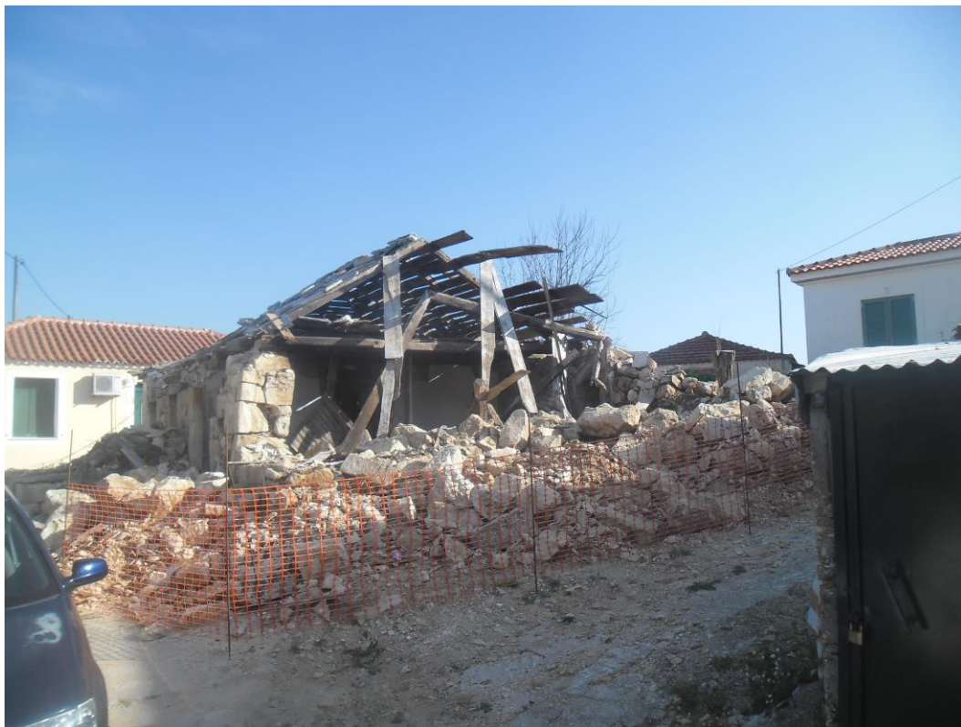
Εικόνα 4 : Χαρακτηριστική εικόνα πέτρινου κτιρίου (προ 1953) στην Παλική λίγο μετά τους σεισμούς του 2014