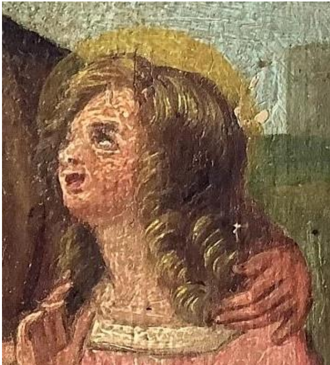
Εικ. 3: Λεπτομέρεια της εικ. 1, Η Παρθένος Μαρία

Το κορίτσι παριστάνεται όρθιο περίπου μέχρι τα γόνατα, κατά τρία τέταρτα προς τα αριστερά ως προς τον θεατή, να κρατεί με το αριστερό του χέρι ταινία με δυσδιάγνωστο κείμενο, η οποία θυμίζει ειλητάριο, ενώ ανυψώνει λυγισμένο το δεξί της σαν σε στάση ικεσίας. Φορεί τριανταφυλλί φόρεμα πάνω από λευκό πουκάμισο. Το ροδαλό παιδικό πρόσωπο περιβάλλεται από μακριά ξανθά μαλλιά με μπούκλες, ενώ ανυψώνει το κεφάλι και κοιτάζει τη γυναίκα με το σκεπτικό πρόσωπο, στο οποίο καθρεπτίζεται μια αδιόρατη θλίψη (εικ. 3). Και οι δύο μορφές φέρουν γραπτό φωτοστέφανο, ενώ δεξιά του κεφαλιού της γυναίκας το εικονίδιο φέρει επιγραφή: Η ΑΓ: ANNA. Τα φωτοστέφανα