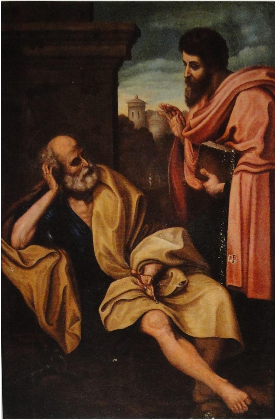
Εικ. 6: Σπυρίδων Παξινόπουλος, Οι Απόστολοι Πέτρος και Παύλος , 1873, ελαιογραφία σε καμβά, 108x75 εκ. (χωρίς λοιπά στοιχεία)

Στο Κοργιαλένειο Μουσείο, εκτός άλλων σώζεται και ένα μεγάλο, ενυπόγραφο και χρονολογημένο εκκλησιαστικό έργο (εικ. 6). Πρόκειται για εικόνα, διαστάσεων 108x75 εκ., ελαιογραφία σε καμβά, με τον τίτλο Οι Απόστολοι Πέτρος και Παύλος , το οποίο φέρει υπογραφή και