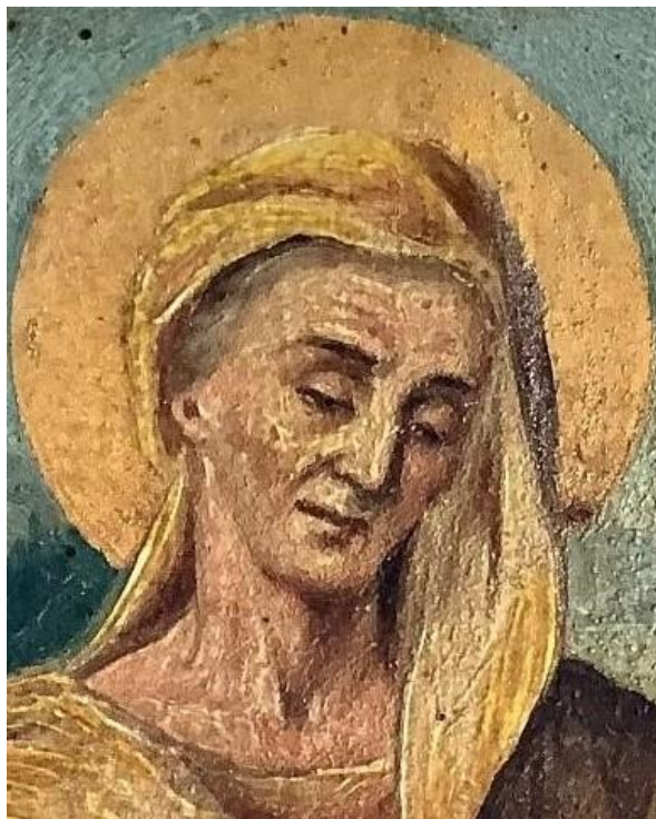
Εικ. 2: Λεπτομέρεια της εικ. 1, Το κεφάλι της Αγίας Άννας

Στενό, γραπτό πλαίσιο κοκκινοφαιού χρώματος ορίζει τον ζωγραφικό χώρο. Αριστερά, μπροστά από ένα τοπίο με γαλανό ουρανό, κάθεται ώριμη γυναίκα, η οποία με το αριστερό της χέρι αγκαλιάζει μικρό κορίτσι που στέκεται στα αριστερά της, ενώ ακουμπάει το δεξί της κάπου είτε στο μη ορατό κάθισμα είτε σε έξαρμα(υψωματάκι) του εδάφους. Παριστάνεται αρκετά μέχρι κάτω από τη μέση. Ο κορμός της αποδίδεται σχεδόν μετωπικά, ενώ το ελαφρά σκυμμένο κεφάλι κατά