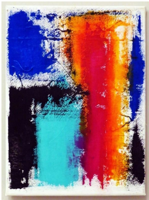
Εικ. 5. Ενθυμούμενος τα χρώματα θερινού ηλιοβασιλέματος , 2023, ακρυλικό σε καμβά, 40x30 εκ.