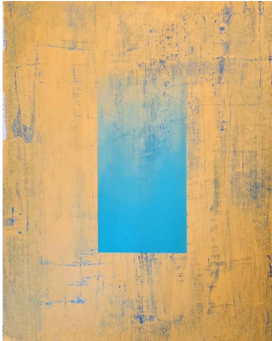
Εικ. 18 . Ντεκό της Ανατολίας 2020, ακρυλικό σε χαρτί, 65x50 εκ.

Κάποια άλλα με την αρμονική τους δομή και την απαλή κίνηση