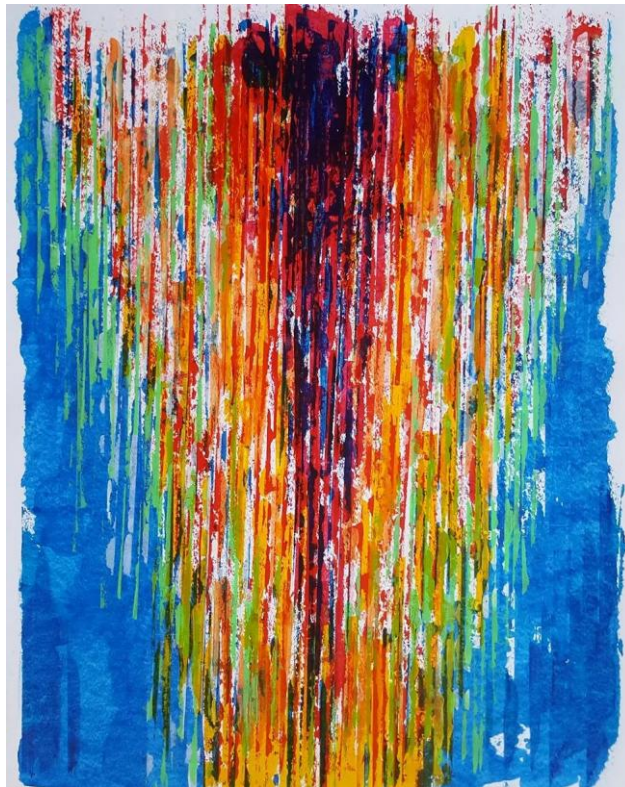
Εικ. 8. Φωνή στο κενό , 2022, Ακρυλικά σε χαρτί 65x50 εκ.