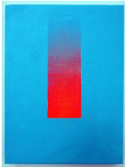
Εικ. 6. Μνημείο για τον Προμηθέα , 2023, ακρυλικό σε καμβά, 50x40 εκ.

ώστε το λευκό να κάνει τα χρώματα πιο ζωηρά. Εξετάζοντας τα έργα της έκθεσης στο Ξι σε συνδυασμό με άλλα προγενέστερα έργα του, διαπιστώνουμε ότι τα θέματα που προτιμά να ζωγραφίζει, για την ακρίβεια τα θέματα από τα οποία εμπνέεται, εκτός από τα παράθυρα, είναι η βροχή, ο καταρράκτης, οι ακτίνες του ήλιου, η θάλασσα, ο λαβύρινθος (εικ. 7, 8, 9, 10, 11).