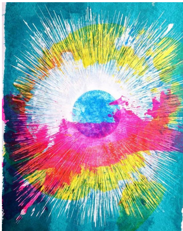
Εικ. 9. Η θεά Ηώς αποκαλύπτει τον Ορίζοντα , 2020, Ακρυλικά σε χαρτί 65x50 εκ.