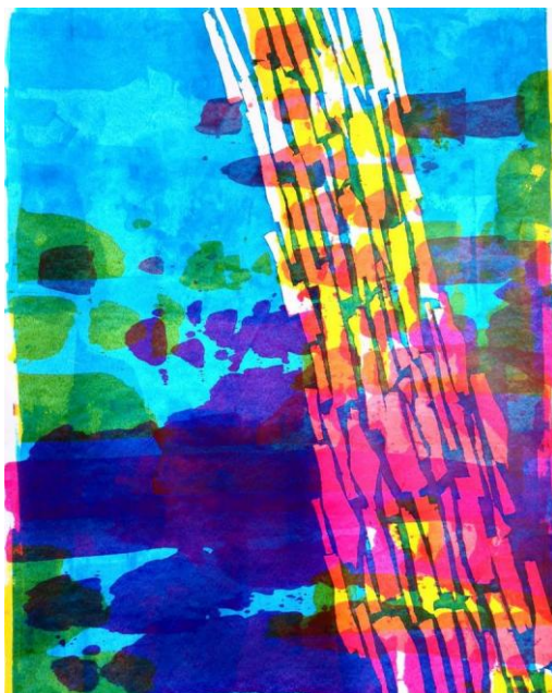
Εικ. 11. Τηλεσκόπιο , 2020, Ακρυλικά σε χαρτί 65x50 εκ.