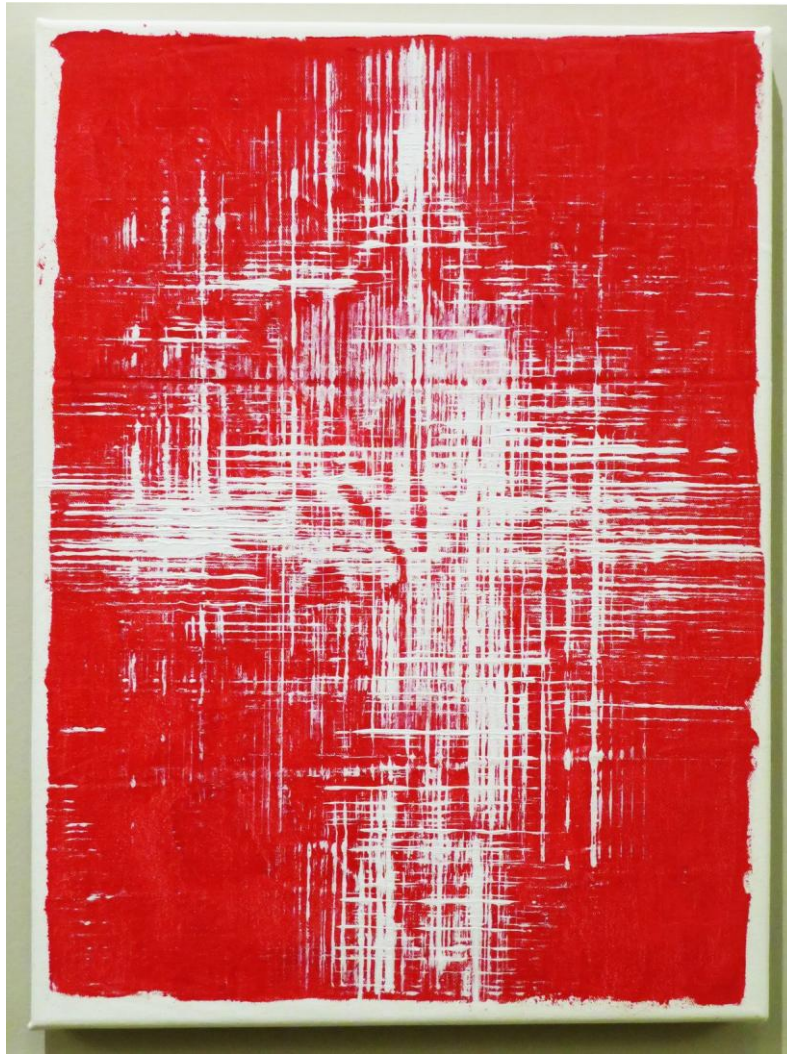
Εικ 13. Οι επιθυμίες που ποτέ δεν υλοποιήθηκαν , 2023, ακρυλικό σε καμβά, 30x45 εκ.

Η πινελιά του είναι ελεύθερη, αλλά δεν είναι πάντα αποτέλεσμα τυχαίας κίνησης, όπως συμπεραίνουμε και από τα δύο-τρία προσχέδια που κάνει κάθε φορά, πριν καταλήξει στο επιθυμητό αποτέλεσμα. Συμφωνούμε με τον όρο «ελεγχόμενη χειρονομία», όπως ο ίδιος χαρακτηρίζει την τεχνική του. Δίνει την εντύπωση, ότι παίζει ζωγραφίζοντας ή ότι μπαίνει στον πειρασμό να αυτοσχεδιάσει, αλλά τελικά οι συνθέσεις του είναι ισορροπημένες, κάνουν φανερή την προσπάθειά του να επιτύχει την ενότητα χρώματος και σχήματος και αποπνέουν μουσικότητα (εικ. 14).