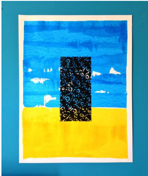
Εικ. 19. Αρμονιόδιο , 2020, ακρυλικό σε χαρτί, 65x50 εκ.

περίπτωση. Το σημαντικό σ' αυτό τον εμβληματικό πίνακα είναι η άκρα λιτότητα των εκφραστικών του μέσων, η ισορροπημένη σύνθεσή του, η απόδοση του ουσιώδους και η δύναμή του να μαγνητίζει το βλέμμα του θεατή και να του υποβάλλει την ανάγκη να δει πίσω από το ορατό σώμα του έργου τέχνης και πέρα από τα όρια της εικαστικής επιφάνειας, μέχρι αυτός να αποκρυπτογραφήσει το κρυφό νόημα του. Η απόδοση του ουσιώδους με τέτοια εκφραστική λιτότητα, χωρίς αναφορές σε ορατά δεδομένα του αντικειμενικού κόσμου, παραπέμπει στη μέθεξη του ίδιου με τη φύση, η οποία έχει εγγραφεί βαθιά στη συνείδησή του. Έτσι μπορούμε να κατανοήσουμε και την εμμονή του στην αφηρημένη τέχνη.