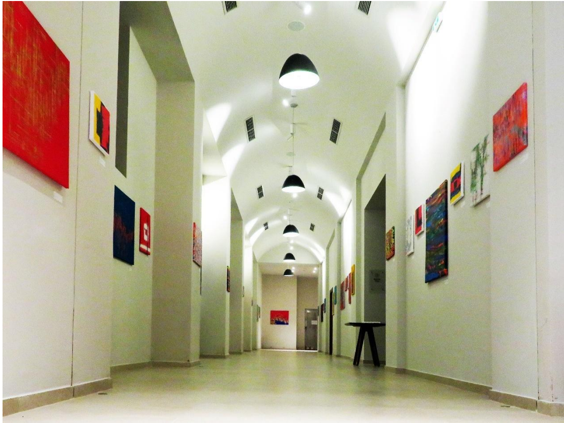
Εικ. 2. Γενική άποψη της έκθεσης

Πρόκειται για αφηρημένες χρωματικές συνθέσεις, δομημένες οι περισσότερες γύρω από ένα ορθογώνιο παραλληλόγραμμο ή τετράγωνο πεδίο, το οποίο λειτουργεί ως παράθυρο και χρησιμοποιείται συμβολικά (εικ. 3).