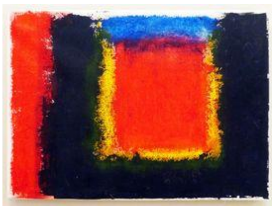
Εικ. 3. Η σκοτεινή πλευρά των ωραίων αναμνήσεων , 2023, ακρυλικό σε καμβά, 30x30 εκ.

Πρόκειται για αφηρημένες χρωματικές συνθέσεις, δομημένες οι περισσότερες γύρω από ένα ορθογώνιο παραλληλόγραμμο ή τετράγωνο πεδίο, το οποίο λειτουργεί ως παράθυρο και χρησιμοποιείται συμβολικά (εικ. 3).