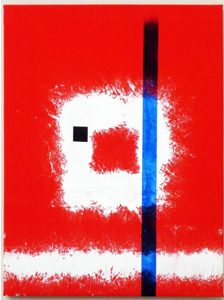
Εικ. 12. Το τελευταίο γράμμα από το ημερολόγιο ενός αλχημιστή, 2023, ακρυλικό σε καμβά, 40x50 εκ.

Όμως στους πίνακές του δίνει ονόματα αλλόκοτα, για να δώσει στους θεατές τους «το στίγμα μιας αφετηρίας έξω από τον ειρμό των σκέψεών τους» (εικ. 12, 13).