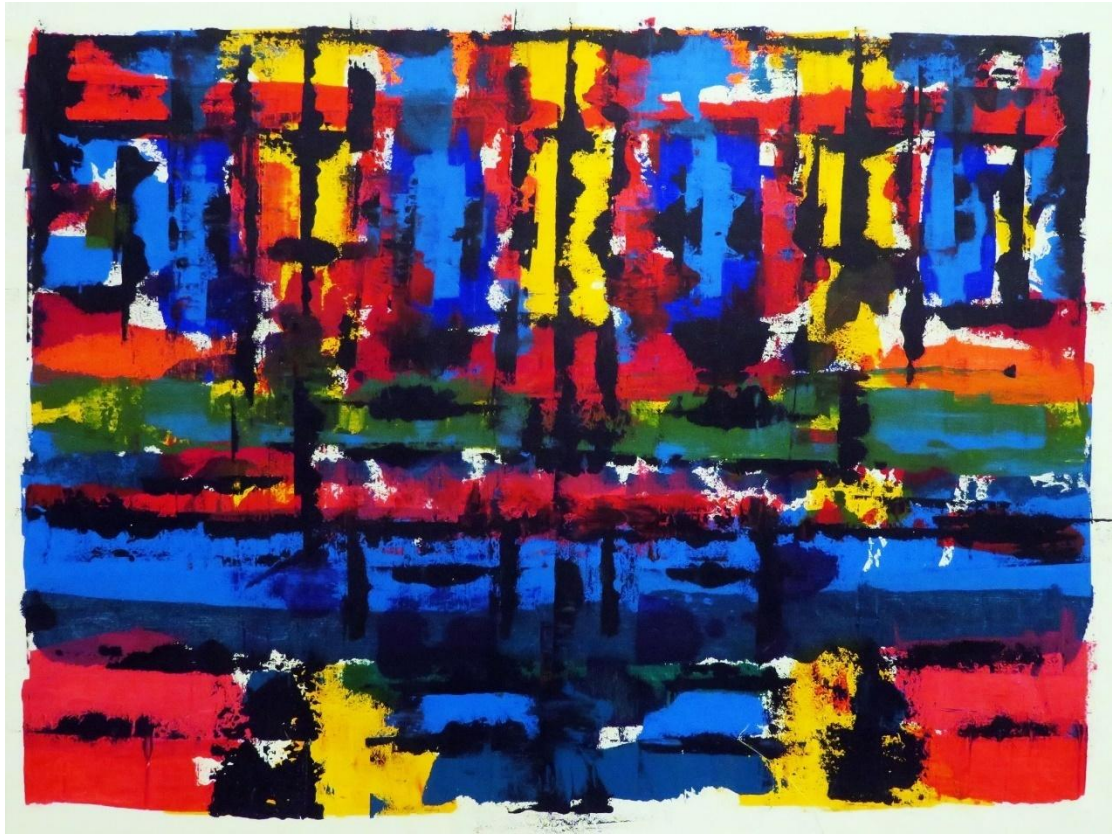
Εικ. 4. Ο Ναός της Αυρηλιανής Ήρας , 2023, ακρυλικό σε καμβά, 70x90 εκ.