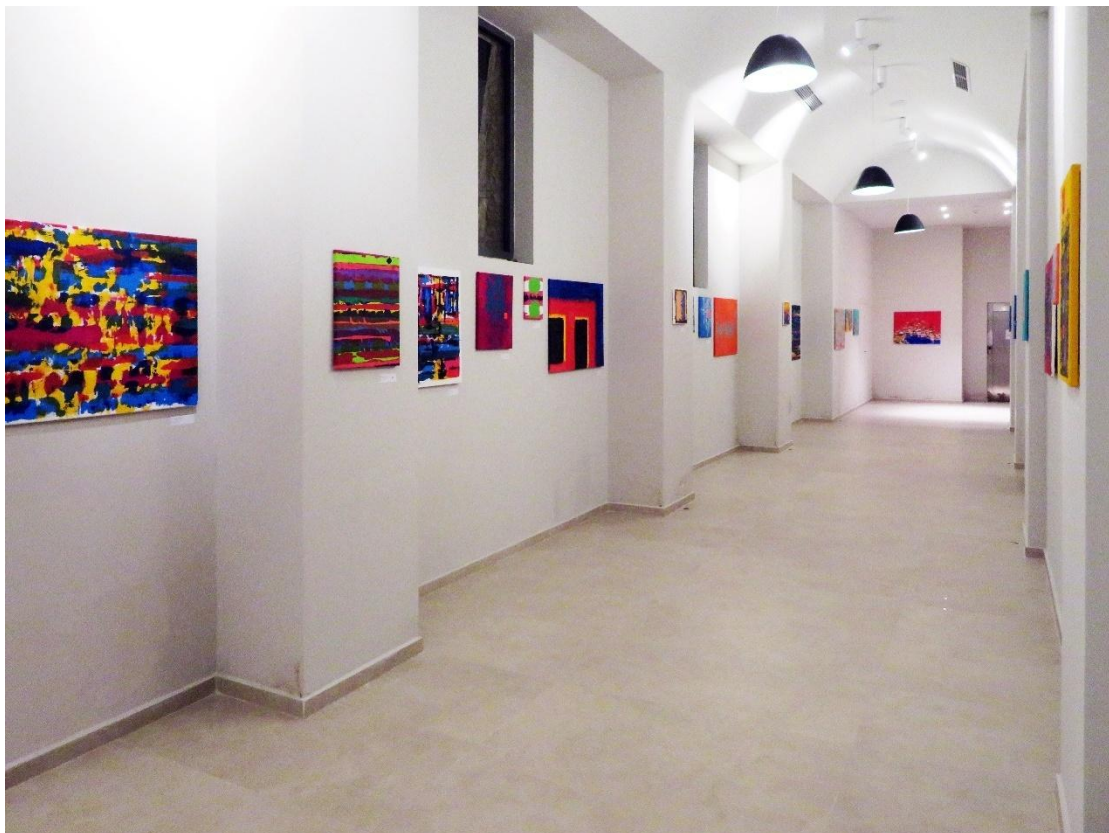
Εικ. 1. Άποψη της έκθεσης

Μια έκθεση ζωγραφικής με τον τίτλο Παράθυρα , στην αίθουσα «Αστερίας» του Ξενοδοχείου Απολλώνιον στο Ξι της Παλικής, από 3-15 Αυγούστου 2023, έκανε γνωστό και στο κοινό της Κεφαλονιάς ένα συντοπίτη ζωγράφο, τον Δημοσθένη Στρίντζη. Έτσι είχαμε την ευκαιρία να δούμε 53 πίνακές του, από τους οποίους οι περισσότεροι είναι μικρού μεγέθους, δουλεμένοι όλοι με ακρυλικό σε καμβά (εικ. 1, 2).