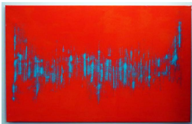
Εικ. 7. Θραύσματα μαρμάρων από τα αγάλματα των περασμένων ειδυλλίων , 2023 Ακρυλικά σε καμβά 70 x 90 cm

ώστε το λευκό να κάνει τα χρώματα πιο ζωηρά. Εξετάζοντας τα έργα της έκθεσης στο Ξι σε συνδυασμό με άλλα προγενέστερα έργα του, διαπιστώνουμε ότι τα θέματα που προτιμά να ζωγραφίζει, για την ακρίβεια τα θέματα από τα οποία εμπνέεται, εκτός από τα παράθυρα, είναι η βροχή, ο καταρράκτης, οι ακτίνες του ήλιου, η θάλασσα, ο λαβύρινθος (εικ. 7, 8, 9, 10, 11).