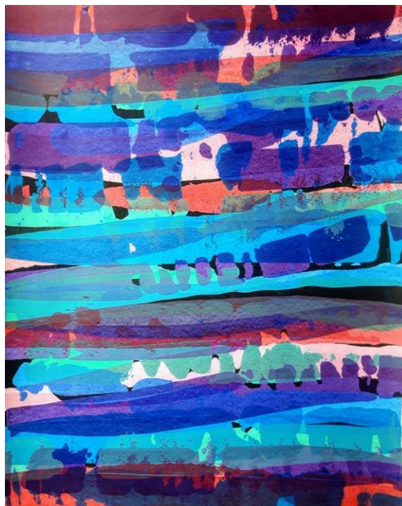
Εικ. 10. Η καταγωγή των φαντασμάτων , 2020, Ακρυλικά σε χαρτί 65x50 εκ.