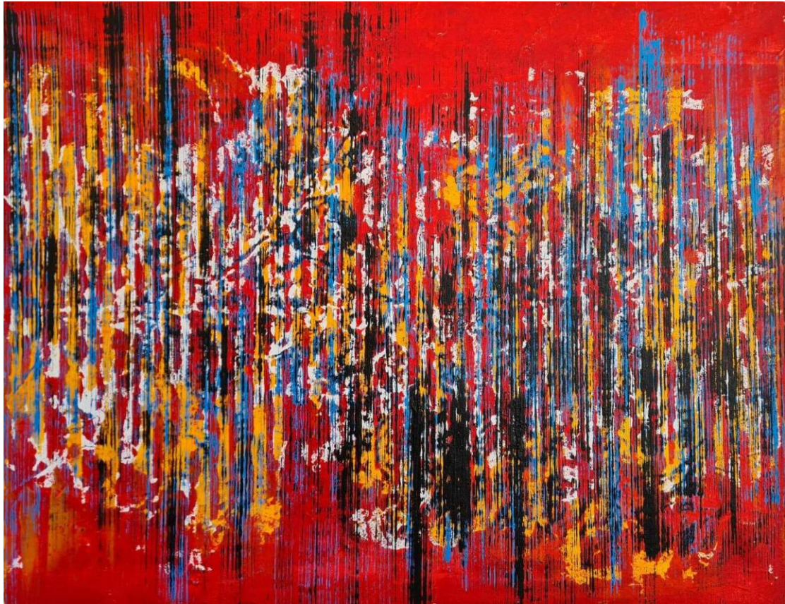
Εικ. 14. Οι καμπάνες της αλλαγής έχουν πάντα τον ίδιο ήχο , 2023, Ακρυλικά σε καμβά, 70x90 εκ.

Η μουσική του παιδεία (παίζει πιάνο) αφήνει το αποτύπωμά της σε κάθε πίνακα. Η μουσικότητα στη σύνθεση απηχεί, βέβαια, και τις επιρροές του από τον Καντίνσκυ (1866-1944). Ένας διάχυτος λυρισμός, ωστόσο, που γίνεται αισθητός από τη ρυθμική κίνηση του χρωστήρα και την ικανότητά των χρωμάτων να εκφράζουν εσωτερικές εμπειρίες και συναισθηματικούς κραδασμούς, απηχεί επιδράσεις από τον Πωλ Κλέε (Paul Klee) (1879-1940), ο οποίος θεωρούσε τη μουσική «μαγεμένη ερωμένη του». Η ανίχνευση στοιχείων στα έργα του Δημοσθένη Στρίντζη από τον Μόντριαν και τον Ντόεσμπουργκ και προπαντός από τον Καντίνσκυ και τον Κλέε, αλλά και από τον Μάλεβιτς και τον Ρόθκο δεν συνιστούν μόνο την κατανοητή επίδραση τους σε έναν αυτοδίδακτο ζωγράφο, αλλά την αναγνώριση της αξίας των μεγάλων δασκάλων ως οδηγών ενός νεότερου, ο οποίος βαδίζει προς τη δημιουργία πατώντας πάνω στα δικά τους χνάρια. Άλλωστε ο ίδιος ομολογεί ότι κάθε φορά που βλέπει έναν πίνακα άλλου ζωγράφου που του αρέσει, νιώθει την ανάγκη να απαντήσει με ένα δικό του έργο.