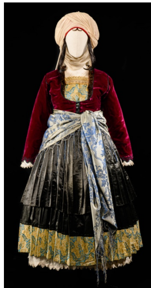
Γυναικεία ενδυμασία από τα Ψαρά.

Επιλογικά, οι παραδοσιακές φορεσιές δεν είναι απλώς ενδύματα. Είναι σύμβολα ταυτότητας και υπερηφάνειας, αποτελούν ένα σημαντικό κομμάτι της ελληνικής παράδοσης αντικατοπτρίζοντας τη ζωή, τις πεποιθήσεις και τις ελπίδες του έθνους και τα όνειρα του λαού. Είναι «ζωντανές αφηγήσεις» της ιστορίας μας που μεταφέρουν από γενιά σε γενιά τις μνήμες, τις αξίες, τις παραδόσεις και εν γένει την πολιτιστική κληρονομιά της Ελλάδος.